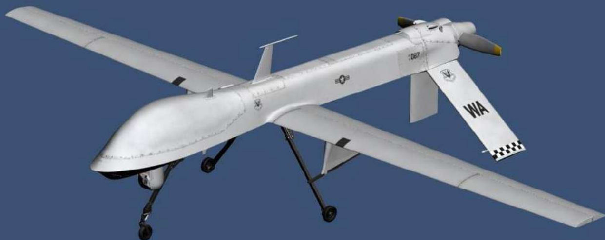
Беспилотник самолетного типа