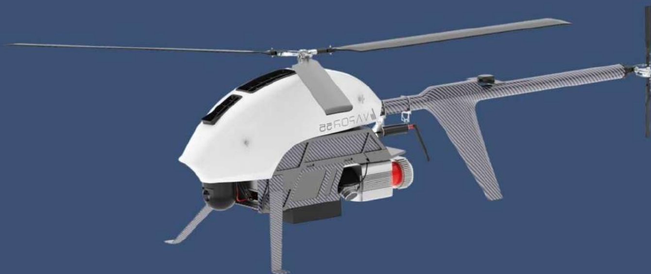
Беспилотник вертолетного типа